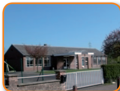
rue Freddy Terwagne, 1 à Strée (Les Gottes) Tél. : 085/51 28 47