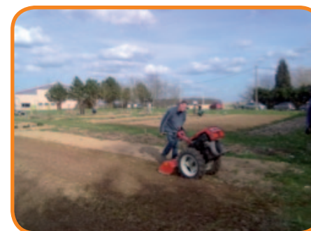
Les premiers travaux de printemps 2013

Plus d'informations : contactez Gervais au 0477/22 42 58 ou par mail : mbaidanoum@yahoo.fr