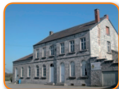
rue du Village, 2 à Modave Tél. : 085/41 28 80

L'école communale : conduit l'enfant à construire ses savoirs, les intégrer et les réinvestir au quotidien. L'enseignement est organisé en cycles fonctionnels dans le souci du respect des rythmes de l'enfant afin de l'aider à parcourir sa scolarité sans rupture. La pédagogie part du vécu, des besoins et des préoccupations de l'enfant pour l'amener dans une démarche participative et réflexive. Une mise en place progressive d'outils et de référentiels, construits avec l'enfant, l'aidera à gérer ses savoirs et ses savoir-faire de manière autonome.