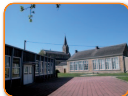
place Georges Hubin, 1 à Vierset-Barse Tél. : 085/41 14 64