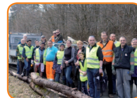
Les habitants satisfaits

Un effort particulier a également été porté sur le haut du Fond d'Oxhe envahi par les immondices. Triste récolte : sacs de langes, plaques Eternit, calandres et sièges de voitures, pneus, tuyaux, ... Au total, ce sont près d'une centaine de sacs poubelle qui ont été remplis en plus d'une grande remorque chargée de détritus en tout genre. Les participants ont terminé la journée par une fricassée conviviale au cœur de leur village désormais bien propre.